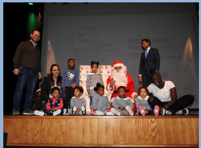
Participação na Festa de Natal “Um brinquedo, Um sorriso” no Auditório Ruy de Carvalho a convite da União de Freguesias de Carnaxide e Queijas.