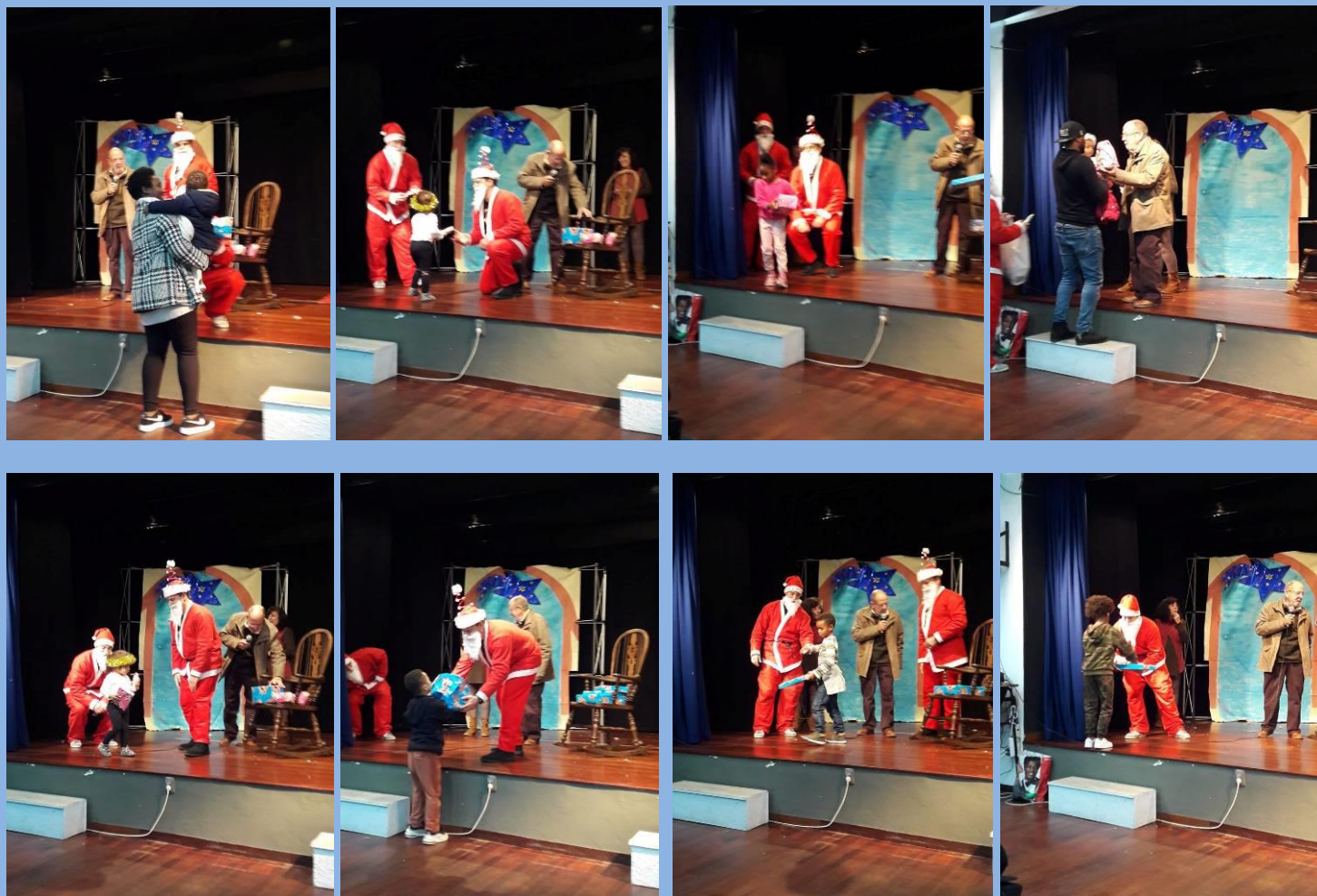
Aula de Zumba e oferta de lembranças pelo Clube de Carnaxide Cultura e Desporto .