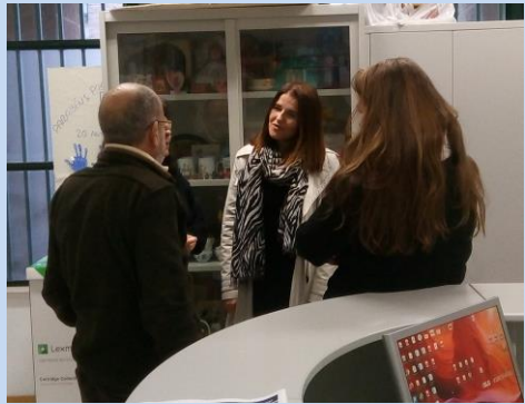
Colaboradoras do Banco BPI Balcão de Carnaxide entregam lembranças às crianças do Berçário / Creche