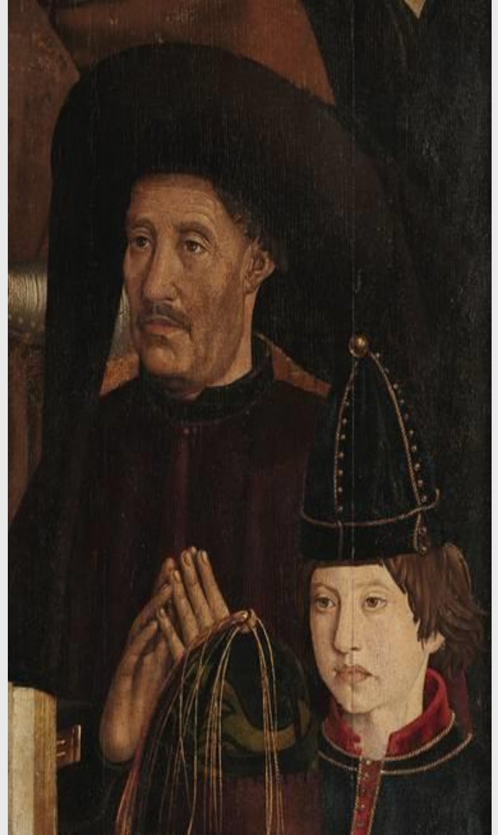
Pormenor de um dos painéis de S. Vicente em que estão representados os dois maiores impulsionadores dos Descobrimientos: o Infante D. Henrique e o futuro D. João II.

Princesa Isabel, nascida em 1397, foi duquesa da Borgonha pelo seu casamento com Filipe, o Bom, em 1429. Foi mãe do célebre duque Carlos, o Temerário. Estimulou as relações entre Portugal, a Borgonha e a Flandres. Interveio junto do seu sobrinho D. Afonso V e do Papa a favor da memória de seu irmão Pedro. Contribuiu para o povoamento dos Açores. Por morte de Filipe, o Bom, em 1460, ela ficou a presidir ao Conselho de Estado.