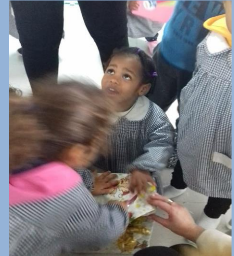
Banco BPI Premium Centro de Negócio de Miraflores entrega lembranças às crianças do Berçário / Creche