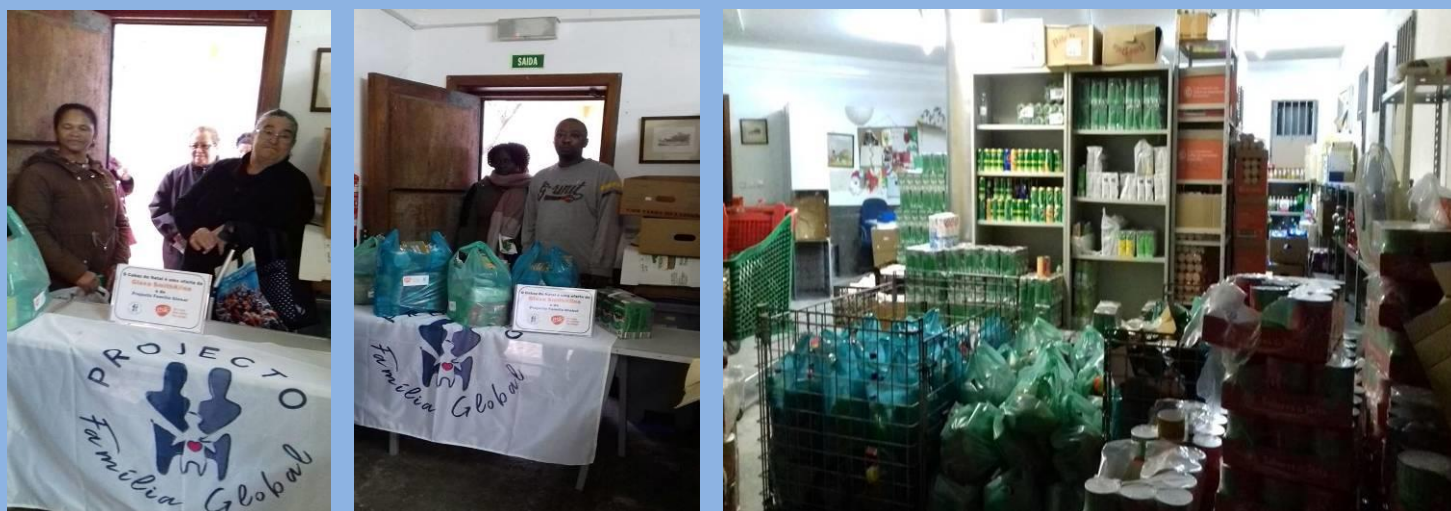
Entrega de cabazes de Natal às famílias carenciadas e idosos acamados do SAD. Uma oferta da Glaxo SmithKline .