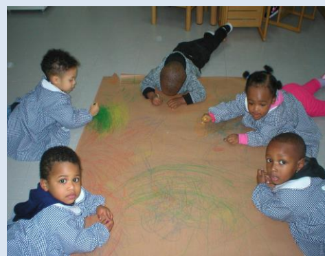
Actividade criativa pelas crianças da Creche